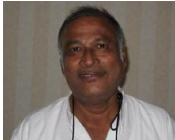
Andrews fra Karigiri