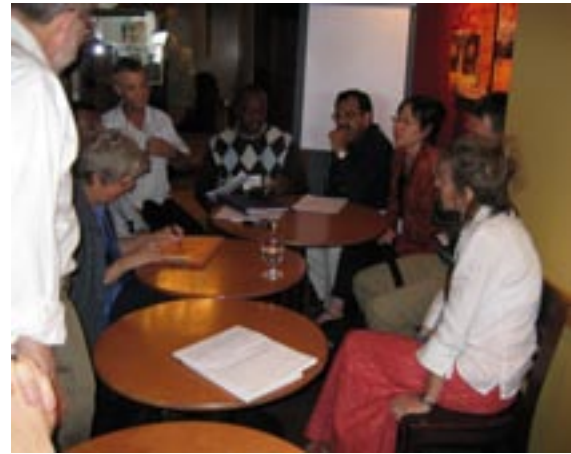
Intens snak om globalt partnerskab

Særlig indtryk gjorde Andrews. Efter, at jeg havde holdt 30 minutters indlæg om "hvordan gøre indsamlingsarbejde som en mindre organisation", ønskede han en samtale med mig. Vi gik op på hans værelse. Her fortalte han mig sin historie – en historie om drengen, der fik spedalskhed og fik begge hænder lammet og mødte megen modgang. Senere fik han hjælp af Spedalskhedsmissionen i Indien, og han fik arbejde på det center i Karigiri i Sydindien, som vi fra dansk side støtter. I dag er han gift og har to børn. Udover sit fuldtidsarbejde på hospitalet bruger han sit liv til at hjælpe børn i samme situation, som han har været i – det er bare vigtigt for ham, at børn bliver hjulpet til en værdig tilværelse og får en uddannelse. Denne fantastiske mand spurgte mig om råd til, hvordan han kunne samle flere penge ind til at hjælpe disse børn – DET gjorde mig ydmyg! Jeg fik stor respekt